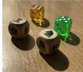
Mögen die Würfel mit dir sein!

Das Osterturnier war ein besonderes Ereignis für unsere Schachfreunde. Anders als beim herkömmlichen Schach stellten nun Würfel alles auf den Kopf, wodurch sich unberechenbare Partien ergaben. Ob nun Türme wie Springer zogen, man bereits geschlagene Figuren wieder einsetzen durfte oder die Stellung mit dem Gegenspieler tauschen musste – niemand war sicher!